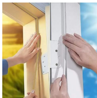
Exemplo de fita veda frestas. Instalar no perímetro dos batentes.