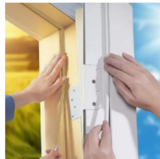
Exemplo de fita veda frestas. Instalar no perímetro dos batentes.

2.3 Forro de gesso com isolamento termo acústico: Sob o forro de PVC existente, e apenas na Sala de Atendimento Psicológico, será executado forro em chapas de gesso do tipo fixo e monolítico com isolamento entre as camadas de forro em manta de lã de pet de mesma especificação das paredes. Todos os procedimentos devem ser realizados rigorosamente de acordo com a NBR 15758-2/2009 e demais normas correlatas.