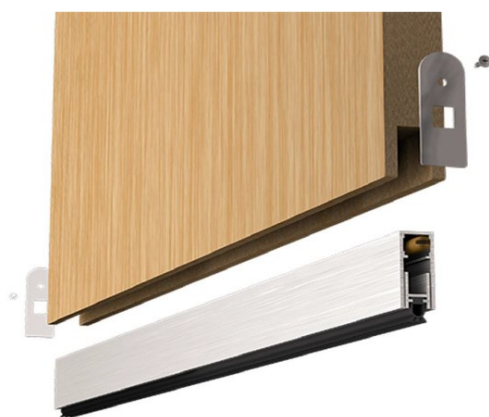
Exemplo de veda porta inferior.

PORTAS A SUBSTITUIR E ISOLAR ACUSTICAMENTE